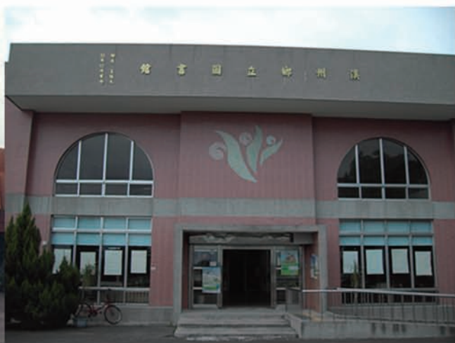
圖書館92年整修外貌