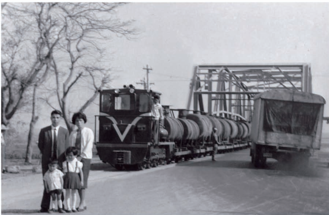
五分仔小火車和汽車、腳踏車並行的情景，只在西螺大橋上曾出現過。（出自《台灣百年糖紀》）