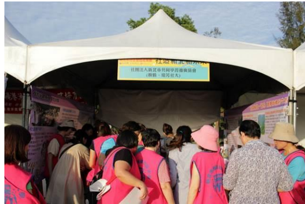
105 年度社區營造成果展(11/19)