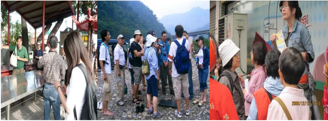
●透過北部水文、運輸的人類開發角度，聯繫起板橋區域在現代發展中的位置，逐步建立居民對於生活所在地的認識。