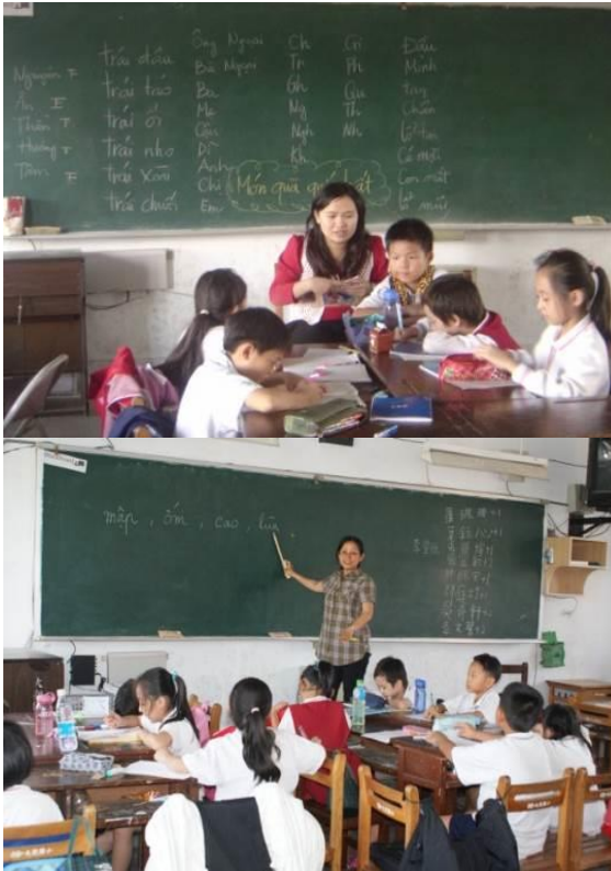
●在浮洲大觀國小進行以越南姊妹為主體的「越南語教學」

板橋地區位在台北與新北市的交界，也是個移民的都市，板橋浮洲地區新移民女性人數比例居高。這些新移民面臨著社會生活與家庭適應的課題，而他們所面對的社會與文化的不平等歧見都在考驗著這些新移民姊妹。因此，板橋社大透過在社區發起多元文化行動方案，包括透過社區劇場、社區女性工藝等方式來參與對於新移民的關懷行動。