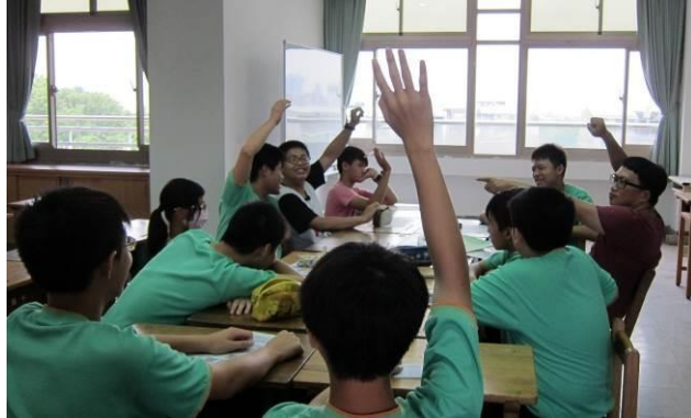
主題一:2. 社區故事停看聽:尋訪社區故事(9/23)