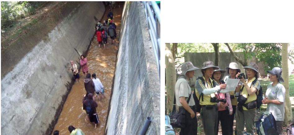
●關懷自然環境社團進行河川環境守護工作。