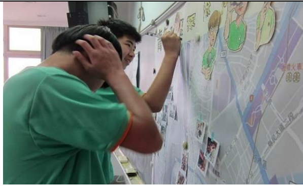
主題三:3. 我的夢想社區行動方案工作坊(10/22)