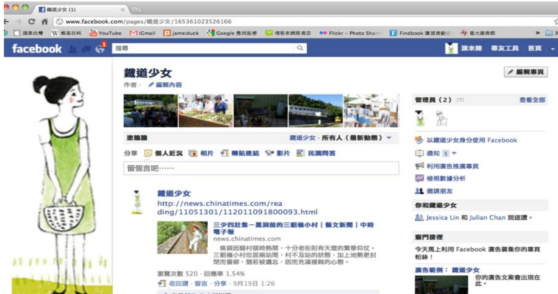
圖說 製作計畫專屬 FACEBOOK(臉書專頁示意圖)