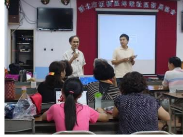
● 埤墘社區的社區地圖與社區影像培力，逐步轉化社區組織投入社區營造工作。