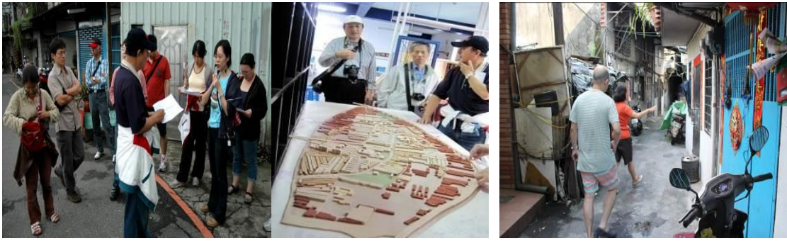
●深入浮洲地區進行田野調查。