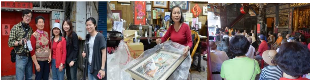
●在浮洲進行的社區紀錄片拍攝與在社區進行的都市更新討論會

板橋現在的居民則多是從台灣中南部鄉村地區遷徙而來。經過幾十年的發展，這些移民開始視這片土地為自己的居住地，家或家園的想像在此地建構出來，生活與生產的網絡也於焉形成。特別是在板橋的浮洲地區，因處都市邊陲又有淹水禁限建而地租便宜，許多無力負擔高地價的移民便落腳於此。直到近年納入都市計畫範圍內後，大舉的都市更新政策開始在當地落實。板橋浮洲的都市變遷可以說是最為劇烈的一處，許多當地民眾對於未來家園即將發生的改變充滿不確定感，原有的生活和工作網絡、地方的歷史與文化脈絡正處於變化過程當中，民眾的觀點如何反應於都市政策當中，是當地的主要社區議題。近年，開始有社造工作者的力量投入在地討論中。