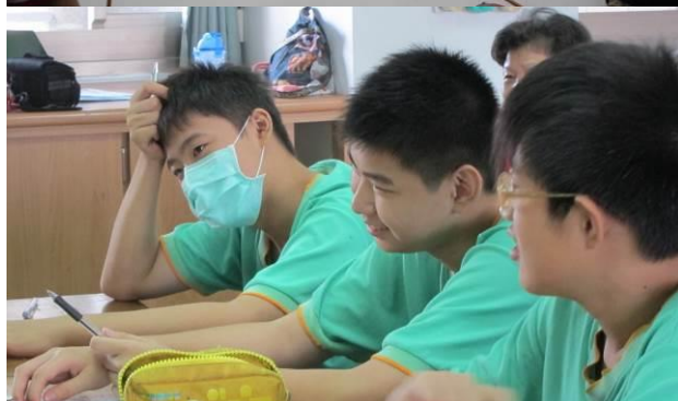
主題三:2. 繪我社區地圖:街與巷 的生活標記(10/15)