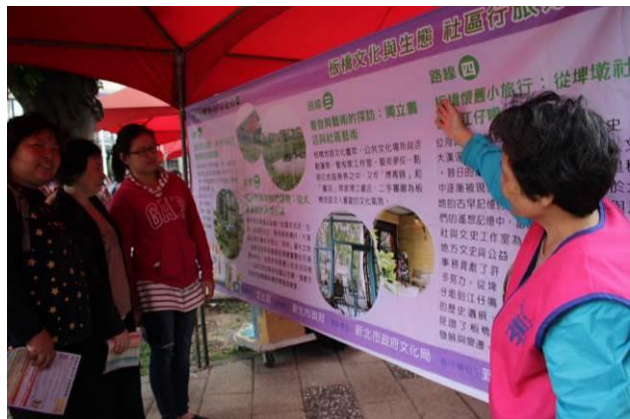
【我的家園城市】文化市集 (10/30)