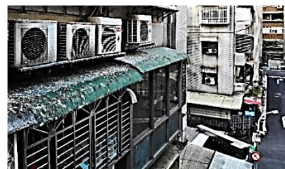
▲鴿糞帶來環境衛生問題。