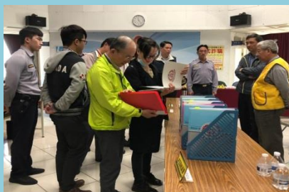
守望相助隊觀摩評鑑