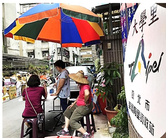
▲大學里辦公處前舉辦資收換好禮活動。