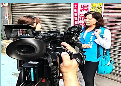
相關店家空氣影響採訪