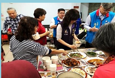
一人一菜慶生餐會