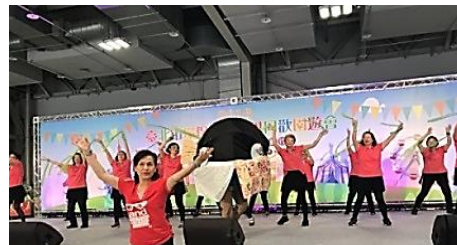
環力四射舞蹈比賽