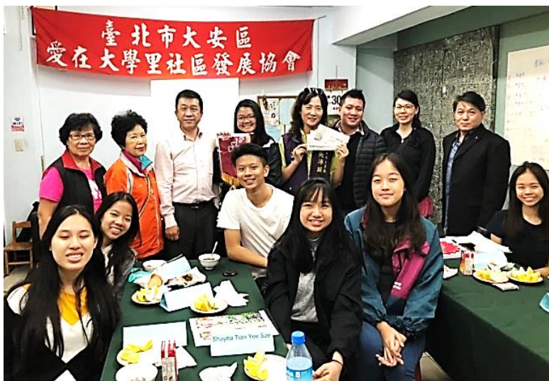
▲新加坡國家初級學院學生參訪大學里。