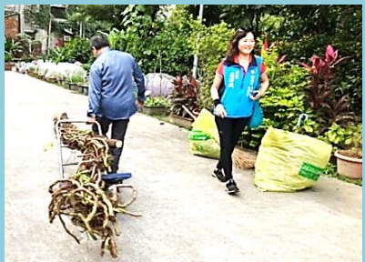
大學田園環境維護