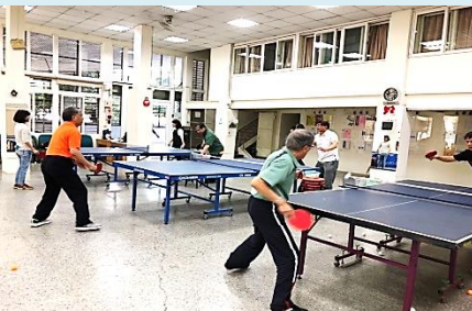
大學里週五桌球社