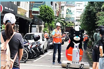
新工處道路工法示範拍攝