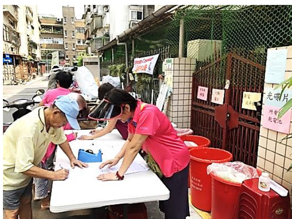
▲環保志工協助資收民眾。

大學里為鼓勵居民資源回收，配合台北市政府和行政院環保署專案，於 107 年 5-10 月舉辦了資源回收活動。每個月 2 次的活動時間內，居民可以將可回收之資收物品，包括電風扇、行動電話、可攜式電腦、廢電腦鍵盤、燈泡、燈管、乾電池、光碟片、玻璃容器、紙類和紙容器，送到里辦資收站兌換點數，再以累積的點數兌換日用品，例如衛生紙、垃圾袋、LED 燈泡、糯米、麥片、洗衣精、洗手乳...等。