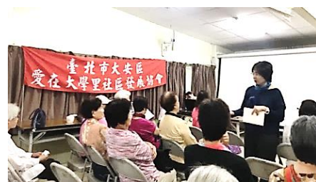
■這部電影引發現場長者的共鳴。