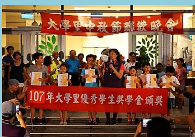
中秋獎學金頒發鼓勵學童