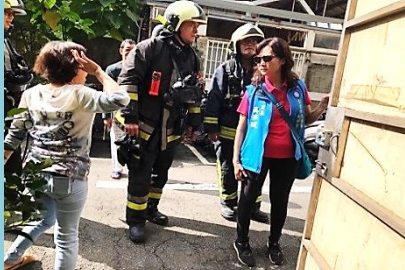
關注里民住屋消防火警