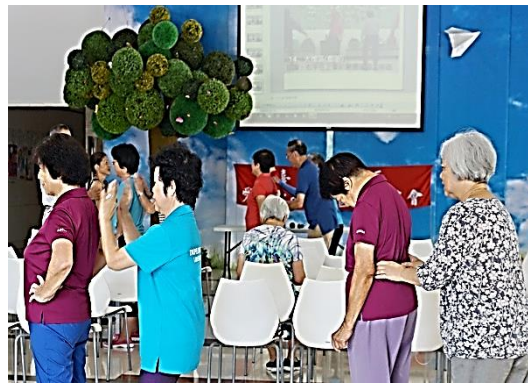
▲每週四上午舉行長者共餐課程。

課程活化長者的大腦、強化肌力、豐富身心，也增進人際的互動。吳里長表示，每個月的課程都視長者的反應略微調，她也努力的爭取經費，豐富課程內容，讓更多人能參與共餐。未來，她期許能做到，掌握每位參與長者的健康記錄和病史，促進長者的健康，發展具有健康活動、宜居的大學里。