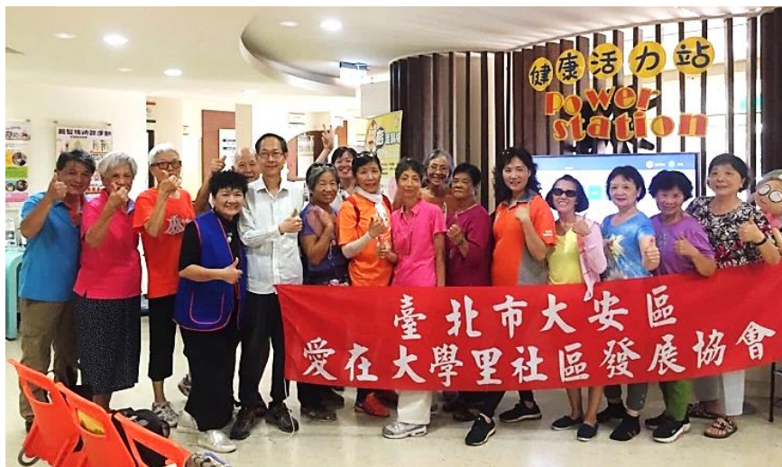
▲大學里里民一同在健康中心身體健檢。